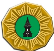
MAJELIS PEMBIMBING SAKA PARIWISATA TINGKAT CABANG